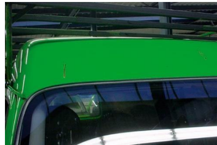
Acceptabel op bedrijfswagen