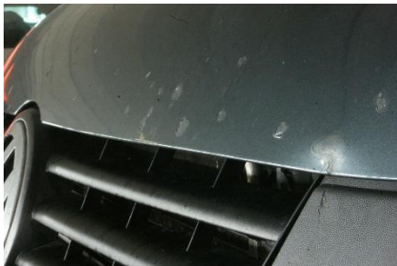
Acceptabel bij meer dan 100.000 km